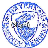
Thomas Hieninger Erster Bürgermeister